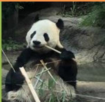
■上野動物園でパンダを見ました。50分待ちました。