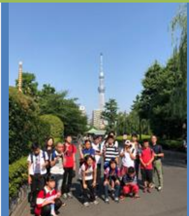
■浅草散策、スカイツリーが見えました。浅草寺の雷門から仲見世を散策しました。人がいっぱいでした。

中学部2・3年生は、3日間東京方面へ修学旅行に行きました。朝早く新大阪駅まで保護者の皆さんも見送りに来ていただき、ありがとうございます。子どもたちにとって思いで多い旅行になったことだと思います。浅草・はとバス・隅田川遊覧・東京ディズニーランド・上野動物園・国立科学博物館などの観光スケジュールを堪能したことと思います。お土産いっぱい・思い出いっぱい。この修学旅行になったかな？