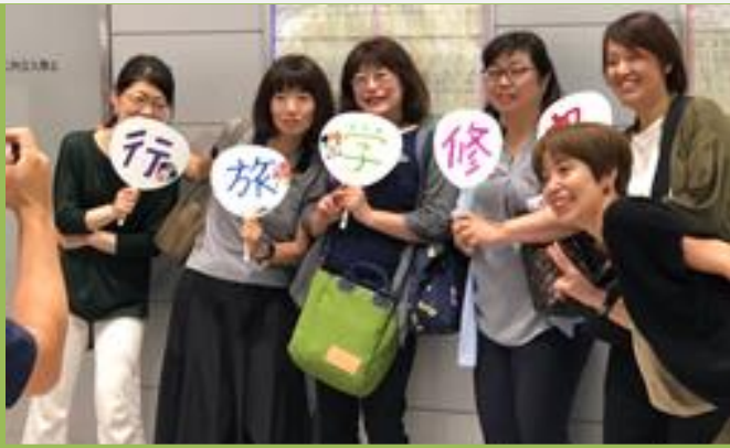
■新大阪駅でお母さん方から「行ってらっしゃい！」

中学部2・3年生は、3日間東京方面へ修学旅行に行きました。朝早く新大阪駅まで保護者の皆さんも見送りに来ていただき、ありがとうございます。子どもたちにとって思いで多い旅行になったことだと思います。浅草・はとバス・隅田川遊覧・東京ディズニーランド・上野動物園・国立科学博物館などの観光スケジュールを堪能したことと思います。お土産いっぱい・思い出いっぱい。この修学旅行になったかな？