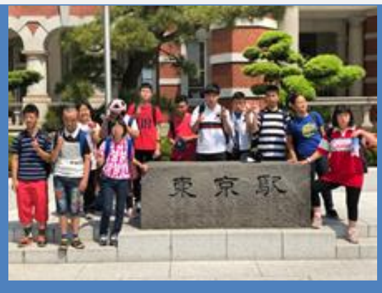
■東京駅で集合！赤レンガ造りの歴史建造物を見ました。